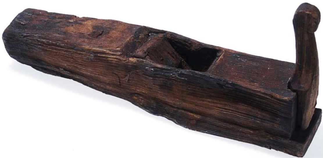
Ett av timmermannens redskap.