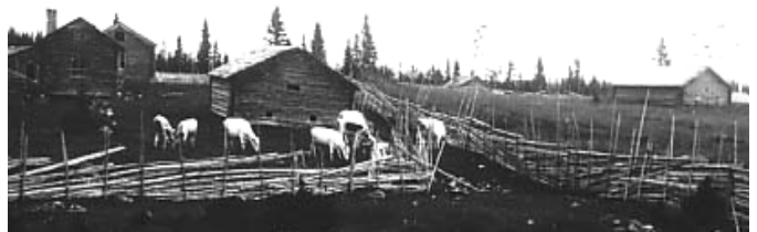
Västra delen av Oxsjövallen. Idag en nutida stuga där